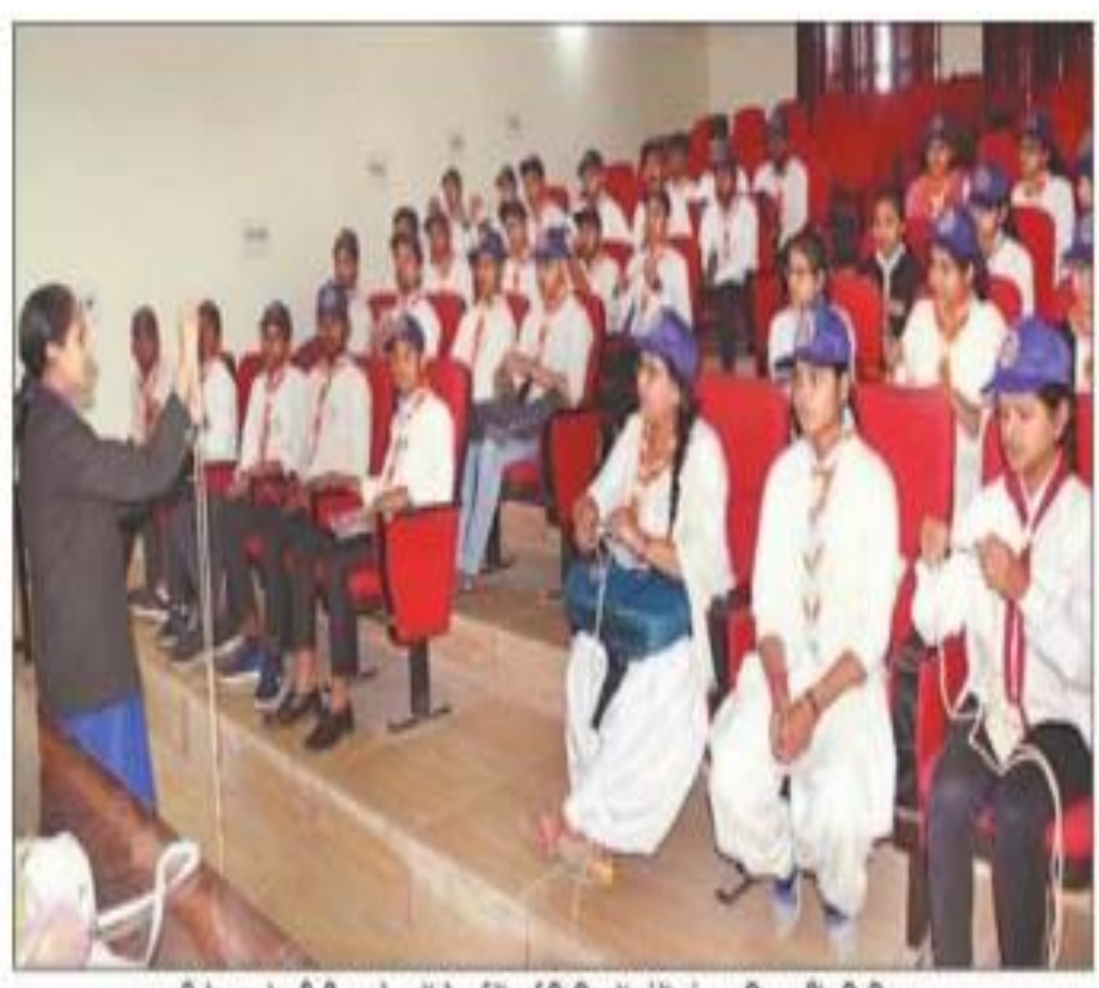
शामली के आरके पीजी कालेज में रोवर्स टेंजर्स शिविर में गांठें बांधना सिखालीं प्रशिक्षिका। साह

राज्यमंत्री कहा कि और चोरी, और धानों थे। आन स है। केंद्र को योगी । उन्होंने से मिलने प्रमहाया। स्कृत में पाल का समें मुख्य वे केन्द्रीय न ने कहा त साल में भा। सप राहजनी वेगे बाब ो अपराध नेचत है। जित सिंह ा कि इस सक्रम्य, दो । सक नह