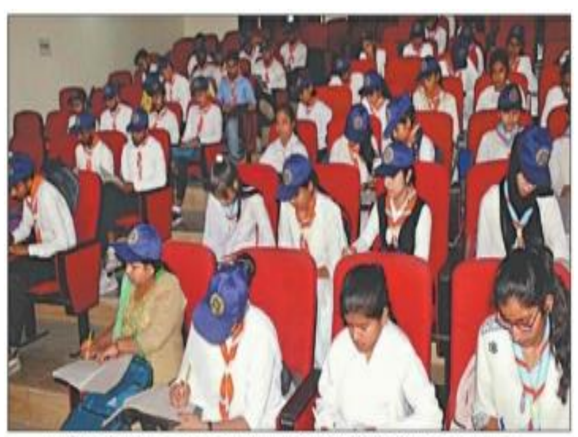
शामली के राष्ट्रीय किसान स्नातकोत्तर महाविद्यालय में रोवर्स रेजर्स शिविर में भाग लेते छात्र-छात्राएं। संबद