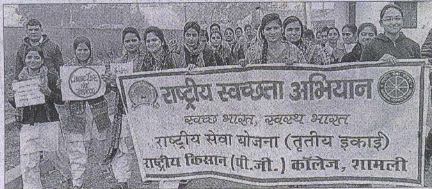
शामली में राष्ट्रीय स्वच्छता अभियान के दौरान रैली निकालती आरके डिग्री कॉलेज की छात्राएं।