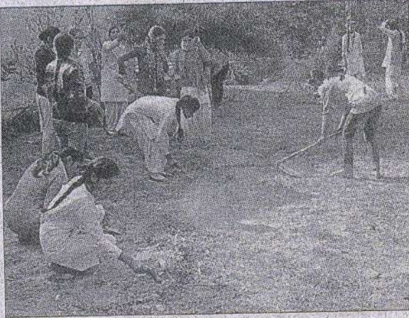
आरके डिग्री कॉलेज में स्वच्छता अभियान चलाती एनएसएस की छात्राएं।