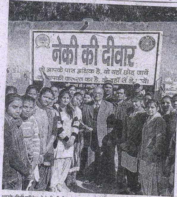
आरके पीजी कॉलेज में नेकी की दीवार बनाने के दौरान छात्राएं एवं शिक्षक